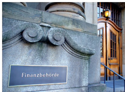
Sicherer Schuldner mit AAA-Rating und Top-Zinsen: das Finanzamt.

auf einen Antrag auf „Aussetzung der Vollziehung“, um im Erfolgsfalle, nach oft jahrelangem Verfahren, die einbehaltene Steuer großzügig vom Finanzamt verzinst zu bekommen.